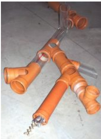
"Lindauer Schere" überwindet auch "verzwickte" Systeme

Sowohl die DIN 1986, Teil 30 "Instandhaltung", als auch verschiedene Landesbauordnungen fordern eine lückenlose Inspektion aller Abwasserleitungen in einem Grundstücksentwässerungsnetz. Gewöhnliche Satellitenkamera-Systeme stießen bislang jedoch spätestens am ersten Abzweig unter dem Grundstück an ihre Einsatzgrenzen. Das Problem des Abbiegens im Untergrund haben wir jetzt mit der sogenannten "Lindauer Schere" erfolgreich gelöst.