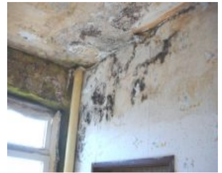
Schimmelpilzbildung in einer Raumecke

Für Fragen steht Herr Frederich gerne zur Verfügung.